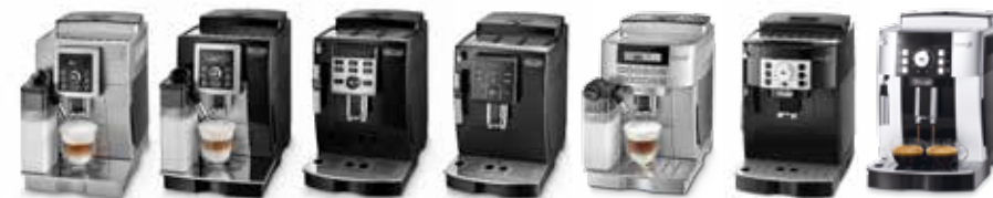
ECAM 23.460.S/B ECAM 23.463.B ECAM 23.123.B ECAM 23.120.B/SB ECAM 22.360.S ECAM 22.110.B/W ECAM 21.117.SB