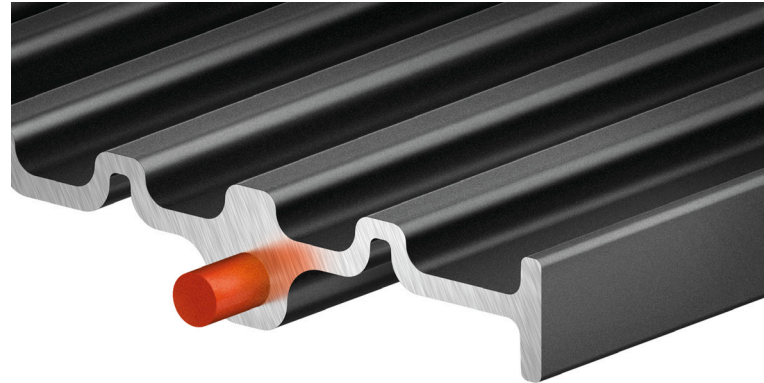
Zapuštěné topné těleso v grilovací desce