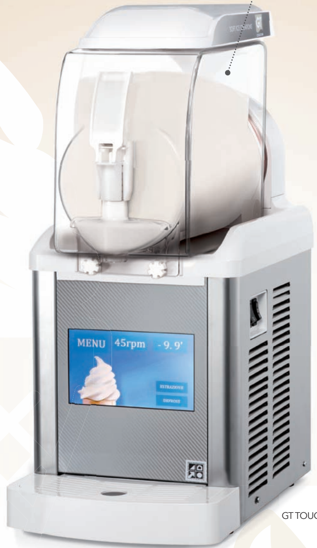
GT TOUCH 1