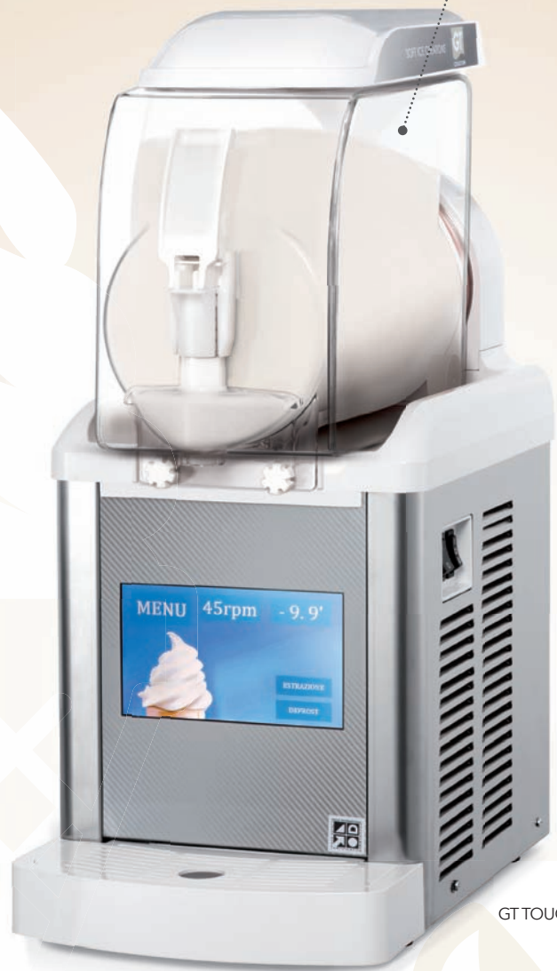
GT TOUCH 1